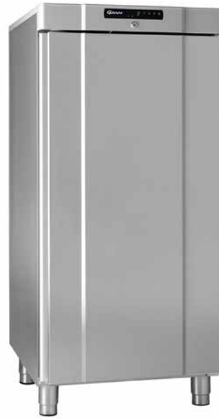
K/F 310 RG