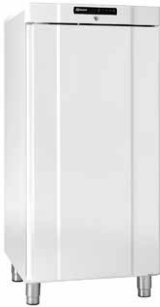
K/F 310 LG